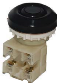
1з+1р, IP54 черный