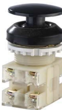
2з+2р, IP54, гриб, черный