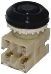
2з+2р, IP54 черный