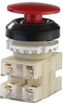
2з+2р, IP54, гриб, красный.