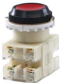
2з+2р, IP40 красный