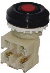
1з+1р, IP54 красный