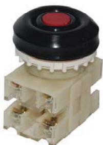
2з+2р, IP54 красный