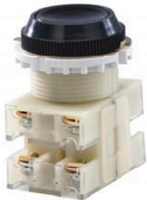
2з+2р, IP40 черный